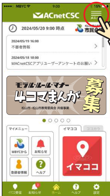
① アプリトップ右上の「メニュー」をタップします