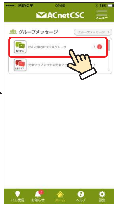
③ メッセージ送信が可能なグループが表示されますので、該当するグループをタップ