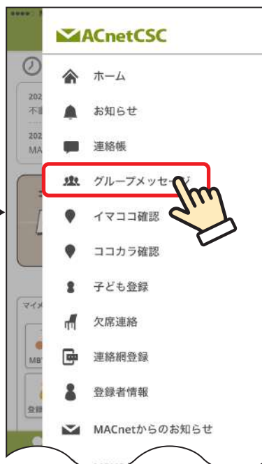
② 「グループメッセージ」をタップ