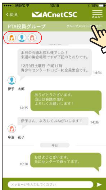
※「グループメンバーを表示」をタップすると所属しているメンバーを見ることができます